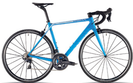
CANYON ULTIMATE CF SL 8.0 CANYON ULTIMATE CF SL 8.0 WMN (Women) Carbon Rahmen, Shimano Ultegra, 52/36, 11-28