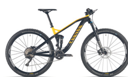
CANYON NEURON AL 7.0 CANYON NEURON AL 7.0 WMN (Women) Alu-Rahmen, Shimano Deore XT, 26/36, 11-42