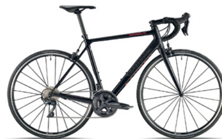
CANYON ENDURANCE CF 8.0 Carbon Rahmen, Shimano Ultegra, 50/34, 11-32