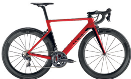
CANYON AEROAD CF-SLX 8.0 Carbon Rahmen, Shimano Ultegra, 52/36, 11-28