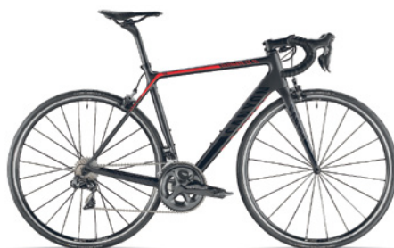
CANYON ULTIMATE CF SL 8.0 Di2 Carbon Rahmen, Shimano Ultegra, 52/36, 11-28, elektr. Schaltung