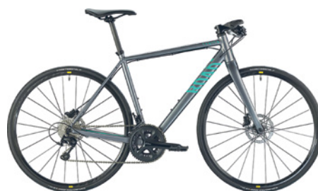
CANYON ROADLITE AL 6.0 Alu-Rahmen, Fitnessbike mit geradem Lenker, Shimano 105, 50/34, 11-32