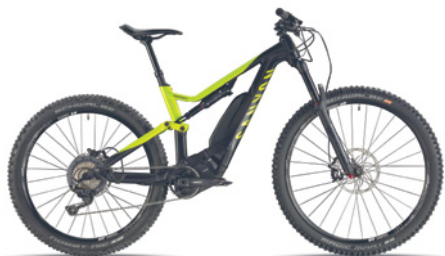
NEU mit E-Motor! CANYON SPECTRAL ON 7.0 CANYON SPECTRAL ON 7.0 WMN (Women) Alu-Rahmen, Shimano DU 8000 Motor mit 250 Watt, Rockshox Yari RC Federgabel, Shimano Deore XT, 34 Vorne, 11-46 Hinten

Alle Räder ohne Fahrradcomputer. Verfügbare Pedalsysteme: wenn anderes, das eigene mitnehmen.